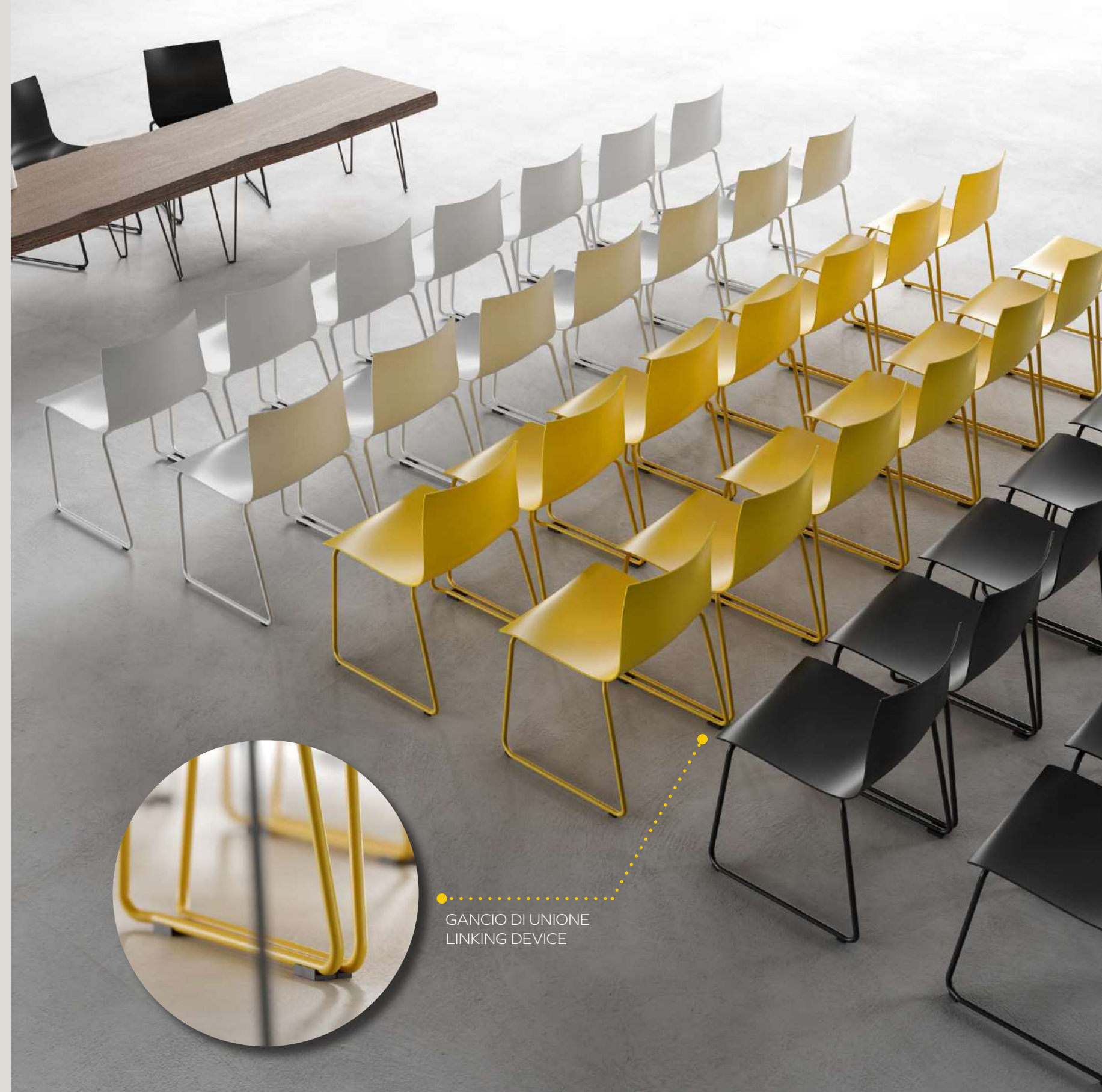
GANCIO DI UNIONE LINKING DEVICE